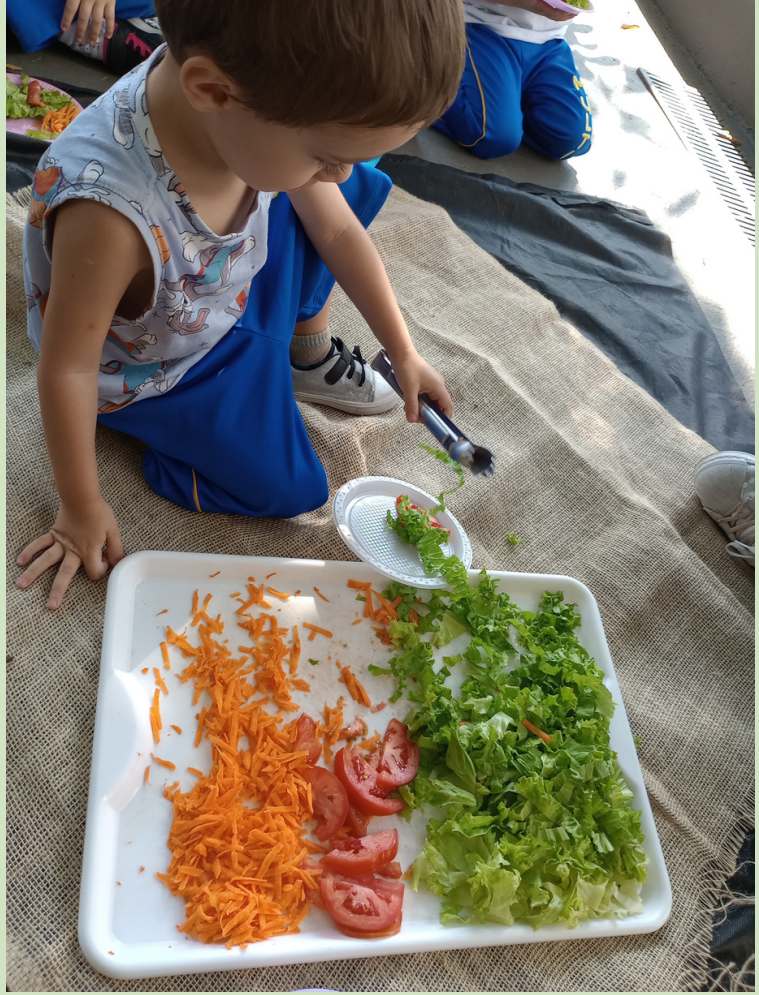
EG: Prô, eu gosto de tomatinho